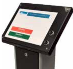
EG - STYLO Totem di distribuzione ticket Totem distribution tickets