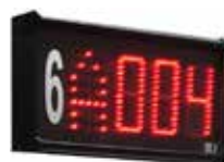
VSP (optional) Display di sportello a Led Led window display