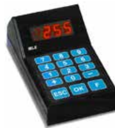
EG - SMN (per utilizzo senza pc) Consolle di gestione e chiamata con tastiera numerica (to use without pc) Console management and called with numeric keyboard