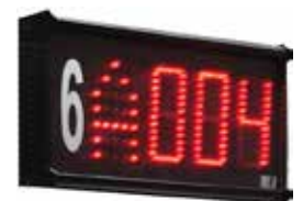
VSP (optional) Display di sportello a Led Led window display