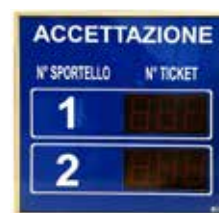
EG - VSA Visore di sala, da 1 a 8 righe Hall display, from 1 to 8 lines