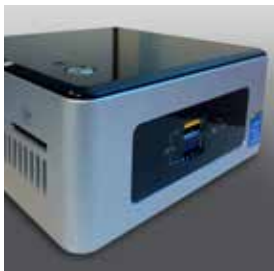
EG - VSA - PC Mini-pc con uscita Hdmi per pilotaggio monitor + Software Mini-pc exit Hdmi to drive monitor+software

Operator will be able to manage the user flows easy.