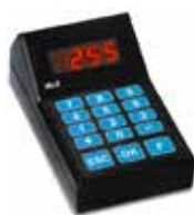
EG - SMN (per utilizzo senza pc) Consolle di gestione e chiamata con tastiera numerica (to use without pc) Console management and called with numeric keyboard