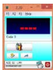
EG - SELECT Consolle virtuale di gestione e chiamata Virtual Console management and called