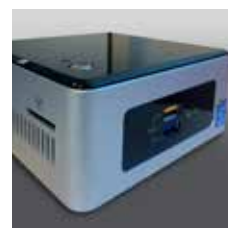
EG - VSA - PC Mini-pc con uscita Hdmi per pilotaggio monitor + Software Mini-pc exit Hdmi to drive monitor+-software