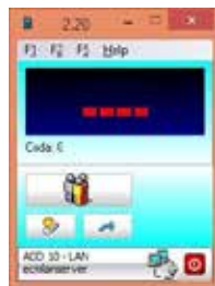
EG - SELECT Consolle virtuale di gestione e chiamata Virtual Console management and called