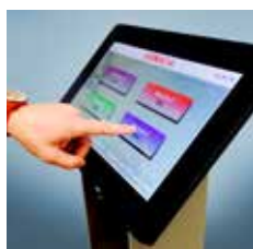
EG - STYLO - TOUCH Totem di distribuzione ticket, con monitor touch screen da 15" Totem distribution tickets, touch screen monitor 15

Users get the reservation and they can visualise their situation on monitors installed, each operator will be able to automatically manage their flow of users.